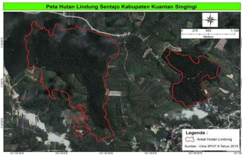
Gambar 1. Peta lokasi penelitian